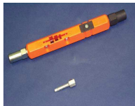
Llave Hexagonal MK-216+V 3/8" y 7/16" con Llave de Seguridad. (WP901002)