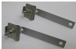
Juego de Soporte para Suspension del Mensajero (WP108951)