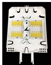
Bandeja de 24F (WP107611)